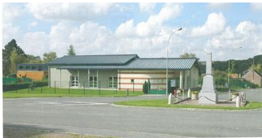
La salle des fêtes.

La création de ce lotissement a permis à la commune un développement harmonieux et l'évolution de la population «en douceur». Sur notre gauche, la rue des Plâtriers, en impasse, permet de rejoindre un petit sentier sur lequel il fait bon flâner. Face à nous, le monument aux morts qui, en le contournant, nous donne accès à la rue Michel, destination la plaine et le point culminant du territoire (110 mètres). Puis la rue de l'Abbaye qui se prolonge par le VC 3 reliant la RD 934 et encore la rue Jacques Hodin. Au passage, contemplons la salle des fêtes construite il y a une quinzaine d'années, salle que de nombreux lecteurs d' Eaux Vives connaissent (elle est mise à disposition pour le repas paroissial tous les deux ans : merci à monsieur le maire et à l'équipe municipale). En descendant la rue Jacques Hodin, deux invi-