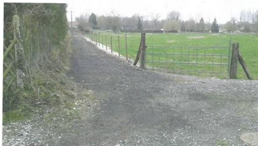
Chemin de la Luce rejoignant la D935.