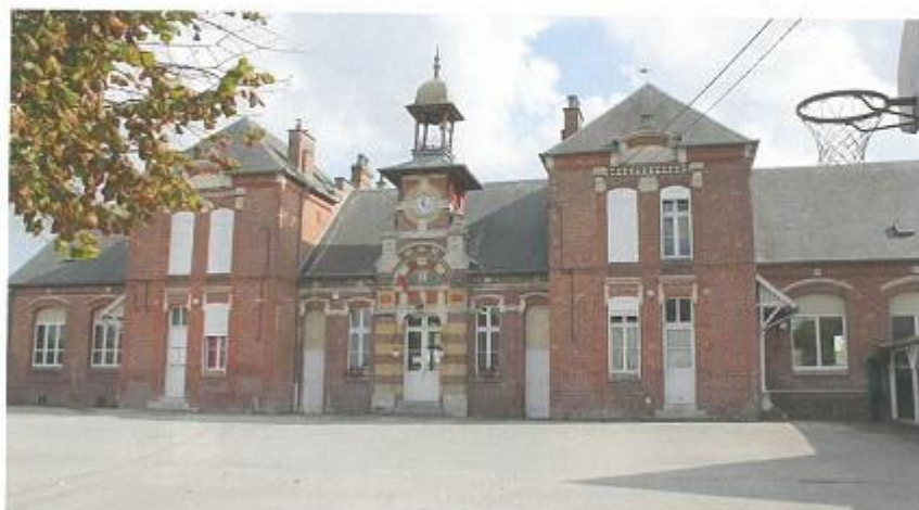
Mairie et école de Thennes.