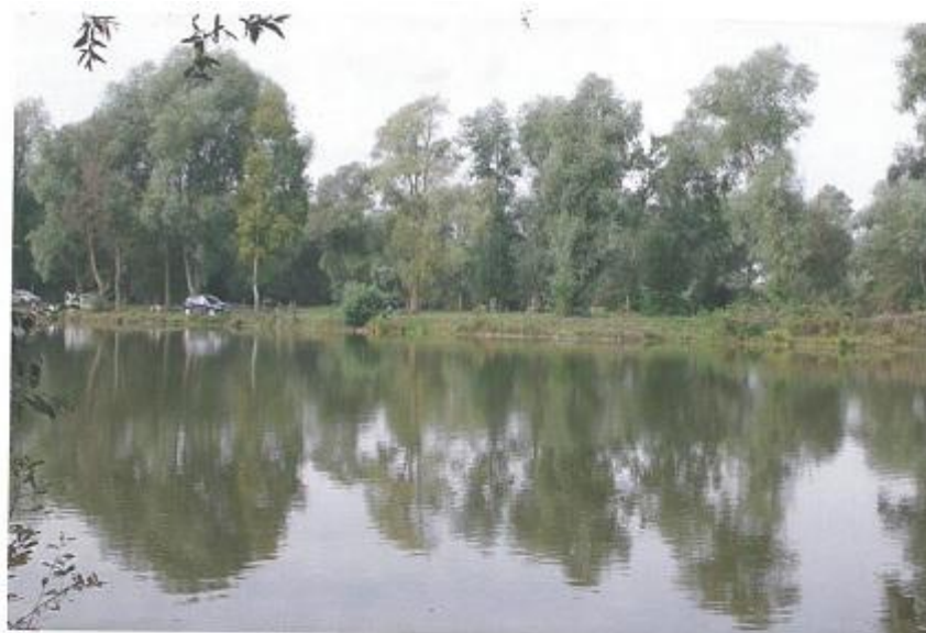
Les eaux bleues.