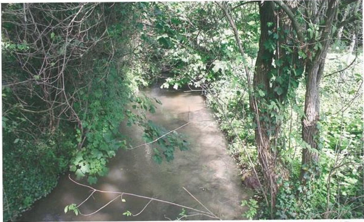
La Luce à Thennes.

N ichée au fond de la vallée de la Luce, adossée à la rive droite de l'Avre, effleurée par la RD 935 filant vers Amiens, la commune de Thennes pourrait passer inaperçue, mais ce serait dommage et ce n'est pas le cas.